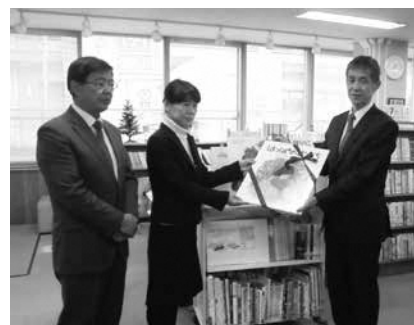
12月20日 絵本の贈呈式