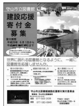
建設応援寄付金ちらし