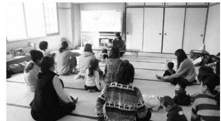
おやこほっとステーション（守山）