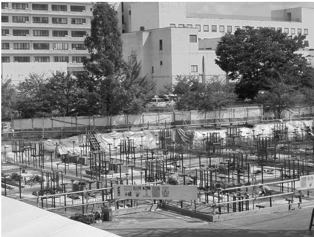
新図書館改築工事