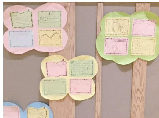
一言メッセージの掲示

内容 「わたしと図書館」をテーマに、利用者から事前募集し、集まったエピソードカード48枚と、図書館開館後、3年間の貸出冊数や主な行事を、木もれびギャラリーで掲示しました。寄せられたメッセージは「本がいっぱいあってうれしい」「もっと本を読みたい」「ゆっくり本を選ぶことができる」等の内容が多くありました。