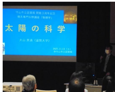
講演会当日の様子

内容 最新の画像や動画も用いながら、太陽の素顔を紹介していただきました。参加者は約半数が学生層で、中高生だけではなく小学生の姿も見え、家族連れで参加された方もありました。参加者からは「例えがわかりやすかった」「太陽について詳しく知ることができてよかった」等、学ぶ楽しさを感じてくださった方が多数いらっしゃいました。