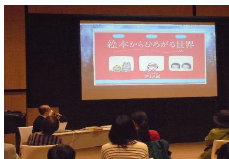
講演会当日の様子

内容 一冊の絵本が出来るまでの編集者や作家の苦労などをお話いただきました。「思いやりとやさしさにつながる豊かな感受性や想像力を育む本を作り続けたい」と話されたのが印象深く、参加者も深く聞き入っておられました。講演会場に展示していた約100冊の関連絵本はほぼ貸し出され、講演終了後、講師に熱心に質問する参加者の姿も見受けられました。