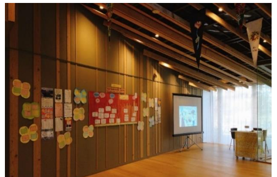
動画の上映と活動紹介の掲示

内容 図書館サポート隊が自ら作成されたお祝いメッセージや、活動を紹介する動画および利用者に図書館や本についてインタビューを行った動画を、木もれびギャラリーで上映しました。14のサポート隊が動画を作成され、それを図書館職員が編集しました。コロナ禍でサポート隊活動が制限される中、コンサートや紙芝居、折り紙など、動画による活動紹介はわかりやすく興味深いものとなり、足をとめてご覧になる来館者の姿も多く見られました。また動画ではなく、カードで活動を紹介されたサポート隊が18あり、写真や絵画などを取り入れ趣向を凝らし作成されていました。