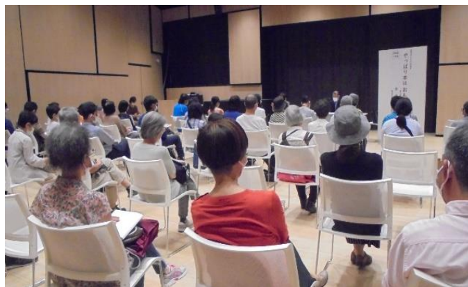
講演会当日の様子

内容 編集者の視点から、現在の出版業界や、作家と出版社の係わりなどを話していただきました。当日は満席となり、講演で紹介された本に予約が入るなど、市民の読書意欲が喚起されたことを実感しました。講演終了後は参加者から「あっという間だった」「ずっと聞いていたかった」などのお声をいただきました。