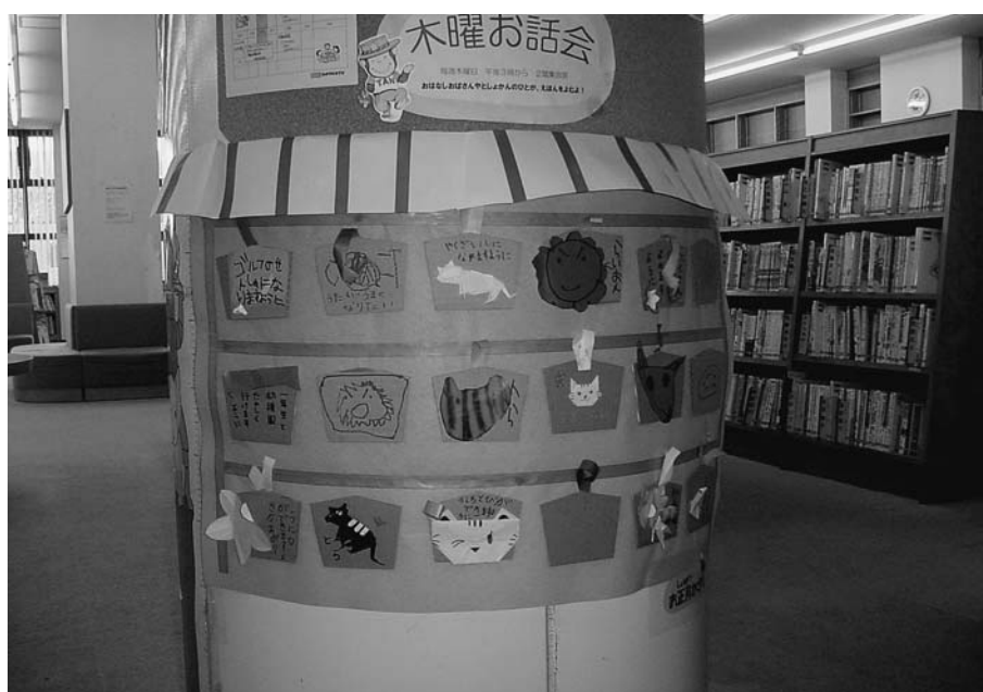
▲としょかんかざり隊！作品（お正月）