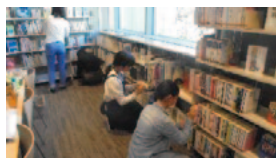
中高生サポーターの活動風景

*市内在住・通学・通勤の方や市内に活動拠点のある団体が登録しています。さまざまな形で図書館をサポート中です。