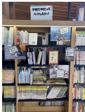
大人向け「子育て中だって〇〇したい！」