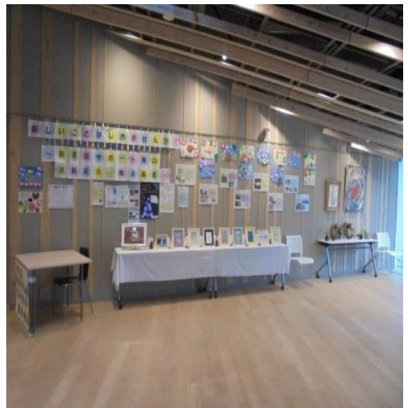
活動内容紹介・作品展示