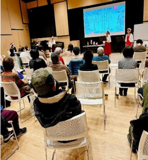
コンサートの様子

を来館者に披露していただける機会を設けました。期間中の図書館サポート隊の各催しには多くの方の参加があり、どの催しも大変盛況でした。特に多目的室での南京玉すだれや腹話術・クリスマスコンサートは用意していた約 50 席が満席になり、立ち見の方もおられました。