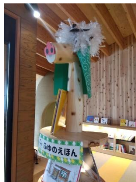
こども向け「ふゆのえほん」