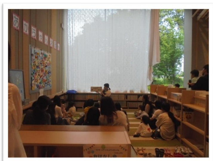
おはなし会【@守山市立図書館・本の森】