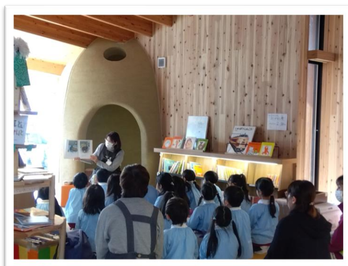
おはなし会【@北部図書館】