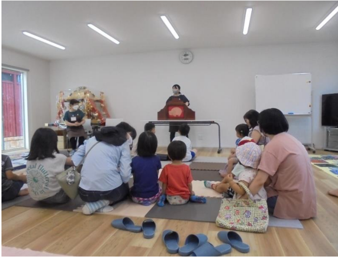
子ども文庫おはなし会【@焰魔堂自治会館】