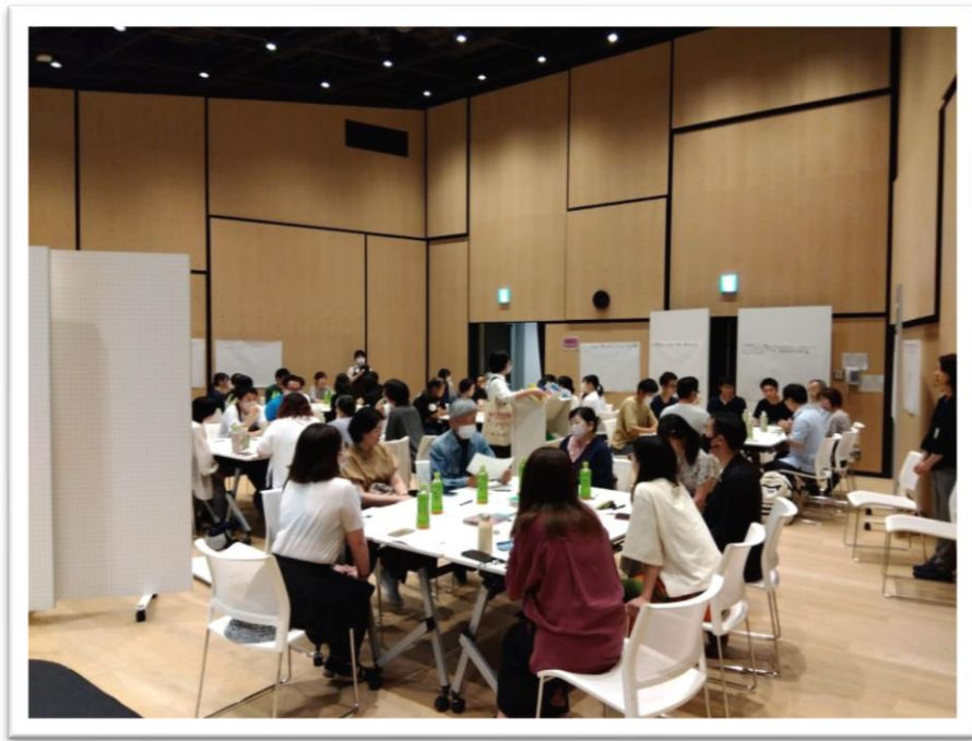
市民懇談会 令和6年6月29日(土) 【@守山市立図書館多目的室】