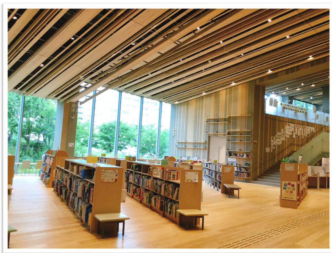
守山市立図書館・本の森・絵本コーナー